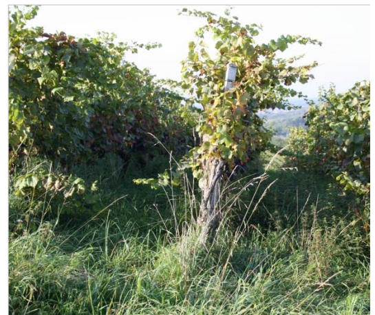
Abb. 3: Mangelnde Laubarbeiten und hoher Unterwuchs fördern die Kirschessigfliege.