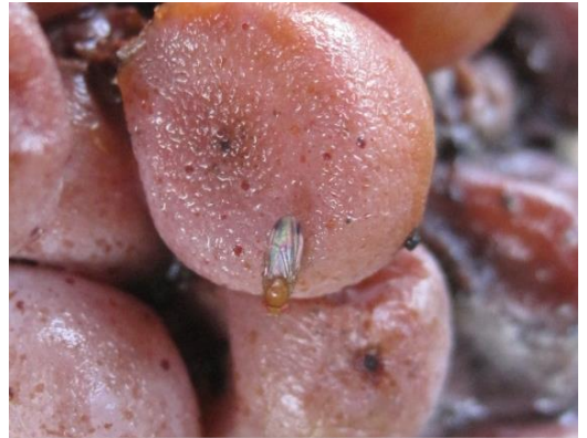
Abb. 1: Männliche Kirschessigfliege auf Riesling nach Fäulnisbefall.