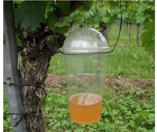
Abb. 4: Standardfalle mit Apfelessig-Wasser-Gemisch für das Fallenmonitoring.

www.vitimeteo.de/monitoring/fallenfaenge.shtml