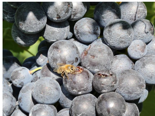
Abb. 6: Durch Vorschädigung von Bienen beflogene Beeren; keine Ausbringung von bienengefährlichen Mitteln.

Nach der Bienenschutzverordnung vom 22. Juli 1992 (BGBl. I. S.1410) dürfen Pflanzenschutzmittel mit der Einstufung B1 (Bienengefährlich) weder an blühenden Pflanzen noch an von Bienen beflogenen nicht blühenden Pflanzen angewandt werden. Honigtau und beschädigte Beeren in den Weinbergen (Abb. 6) sind generell als Warnsignal zu werten, selbst wenn momentan kein Bienenflug beobachtet werden kann. Die Ausbringung von B1-Mitteln sollte auch in diesen Fällen unterbleiben. Wie im Jahr 2014 und 2015 wird die Weinbauberatung auch 2016 die Bienenschutzausschüsse über die aktuellen direkten Bekämpfungsmaßnahmen informieren.