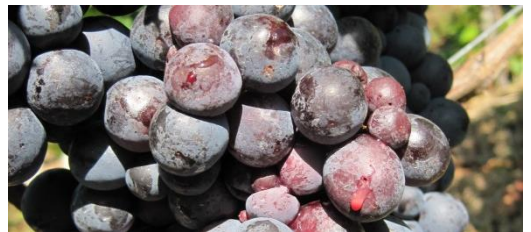
Abb. 2: Befallsauswirkungen durch Kirschessigfliege bei Trollinger.

Auch auf weiteren Rebsorten (z.B. Spätburgunder, Schwarzriesling) wurden lokal und lagenweise Eiablagen beobachtet. Im Mittel waren diese Sorten aber in viel geringerem Umfang belegt als die in der Tabelle aufgeführten Sorten. Die Ergebnisse decken sich mit denen aus anderen Weinbaugebieten im In- und Ausland.